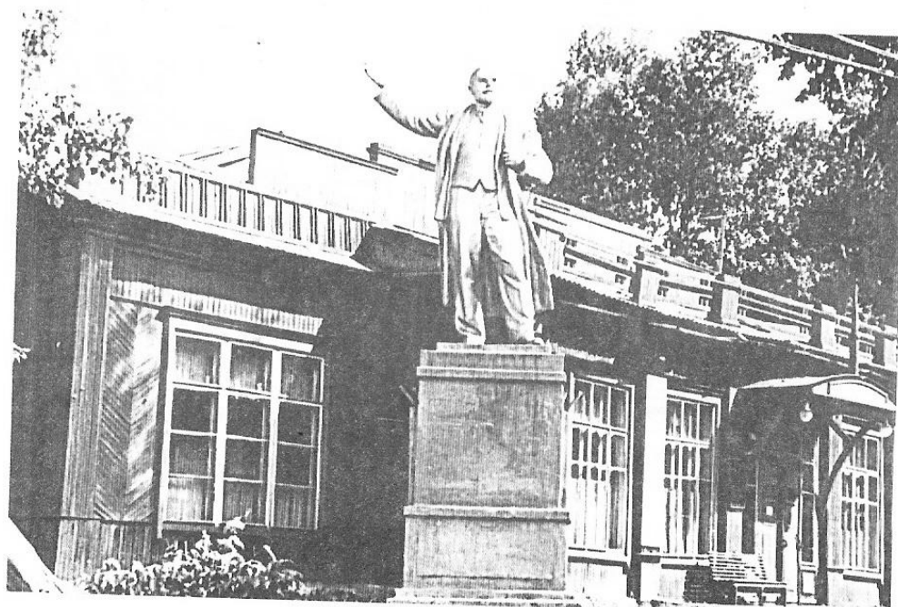
Дом техники.